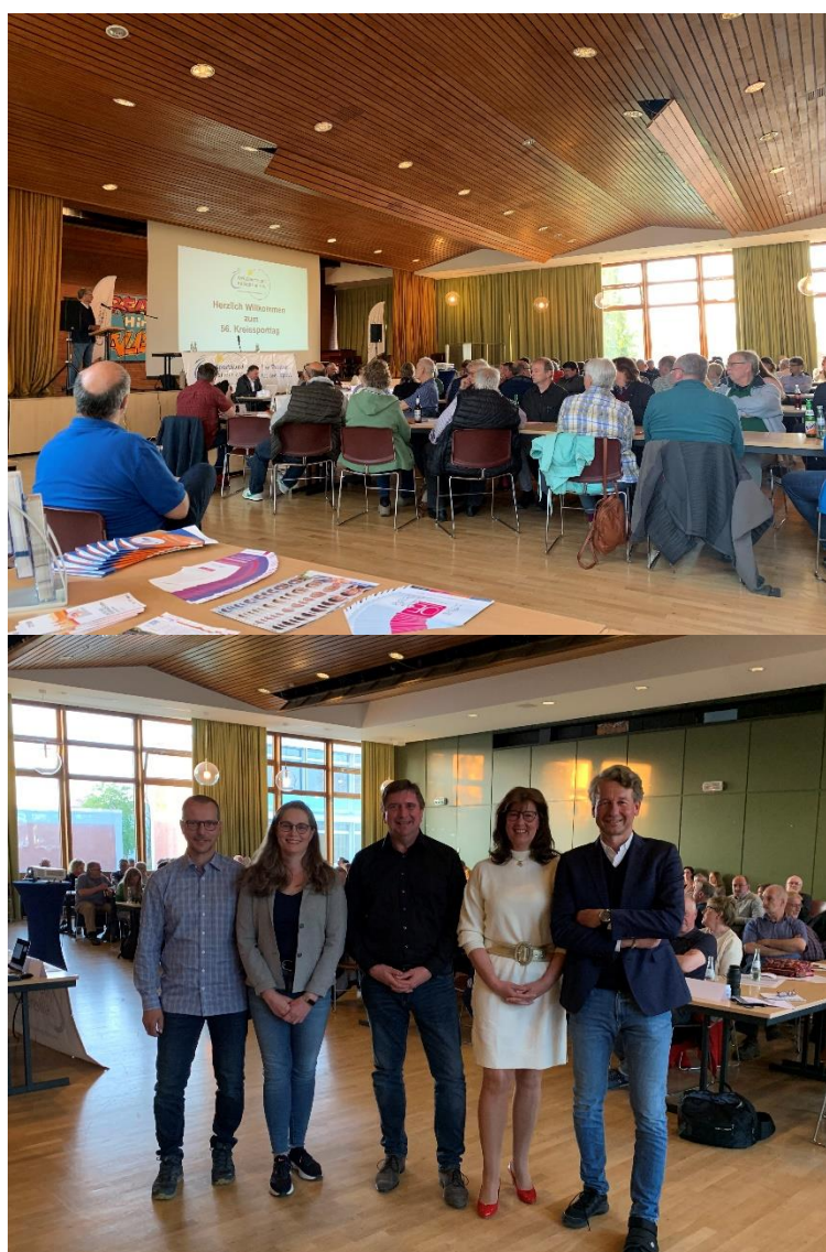
Vorstand des KSB Hildesheim (Foto):